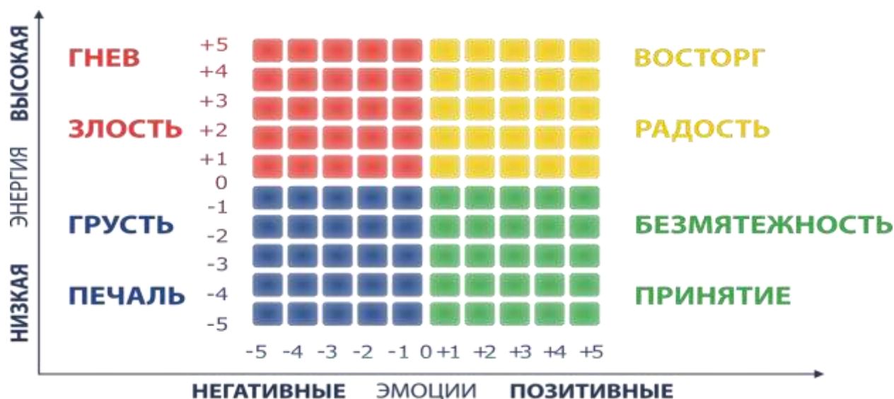
Рисунок 3. Измеритель настроения

Когда вы определите уровни энергии и «приятности», вы попадете в один из четырех квадратов: