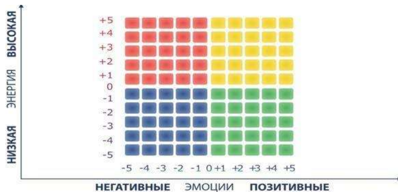
Рисунок 2. Измеритель настроения

В основе этого инструмента лежат два компонента эмоций: позитивность (приятность ощущений от эмоции) и энергия . По оси X откладывается степень приятности : от неудовольствия до удовольствия . Ось Y - уровень энергии: от низкого уровня до высокого уровня (Рисунок 2, вывод на экран презентации)